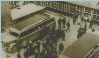
Transport mit den „Grauen Busen“