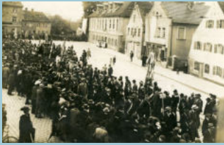
Neuburgerstr.45 mit dem Gasthof Grüner Kranz