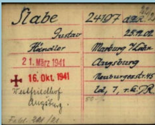
Karteikarte Schreibstube Dachau