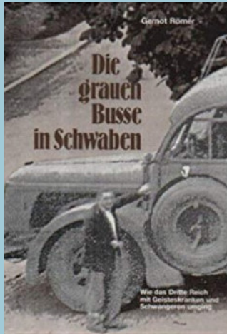
Deportation mit dem „grauen Bus“ Foto Buchumschlag Römer Gernot: Die grauen Busse in Schwaben

NS Tötungsanstalt Hartheim bei Alkoven in Oberösterreich Foto: http://www.annefrankguide.net/de-AT/content/V4F.Hartheim.jpg