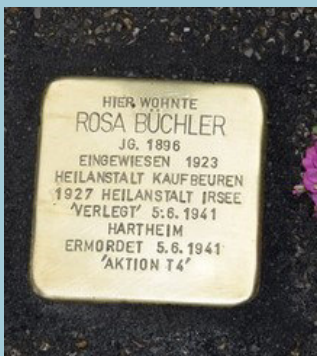
Stolpersteinverlegung am 14.7.2018 am letzten freiwilligen Wohnort im 4. Quergäßchen 7

Erinnerungsblatt 20 (2018) zusammengestellt durch die Stolpersteininitiative Augsburg