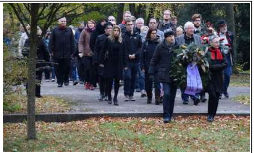
120 Menschen beteiligten sich an der Gedenkveranstaltung