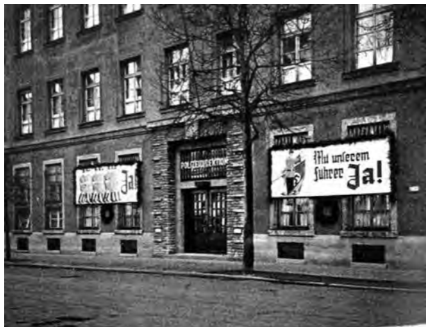
Gestapo-Hauptquartier in Augsburg