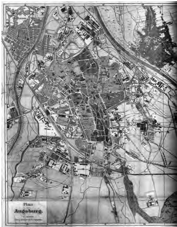
Die Wohn- und Arbeiterquartiere (in der Karte dunkel) Augsburgs

Aus der Industrialisierung entwickelte sich die ArbeiterInnenbewegung. Zeitgleich trat das Problem der sozialen Frage auf den Plan und war seither eng damit verbunden.