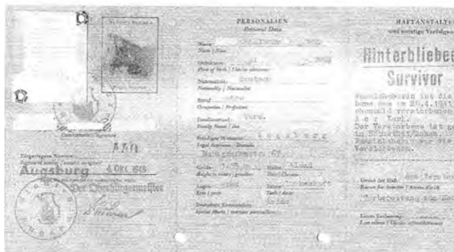
Hinterbliebenen-Ausweis, ausgestellt durch die Stadt Augsburg während der Zeit der US-Besatzung

Rosa Högg und ihre Kinder beantragten dann 1947 eine Todeserklärung um eine Rente für die Mutter beantragen zu können. 1949 erst war es möglich,