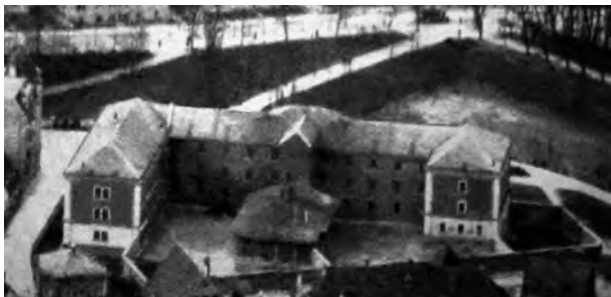
Luftaufnahme vom Katzenstadel

Der Katzenstadel war ursprünglich eine Verteidigungsanlage der Stadtmauer zu Verwahrung der »Katzen«. Katzen nannte man im Mittelalter die Mauerbrecher, eine Belagerungsmaschine. Seit dem 19. Jahrhundert war hier das Landgerichtsgefängnis. Die NSDAP nutzte es eifrig meist als Durchgangsstation vor der Weiterleitung der Gefangenen