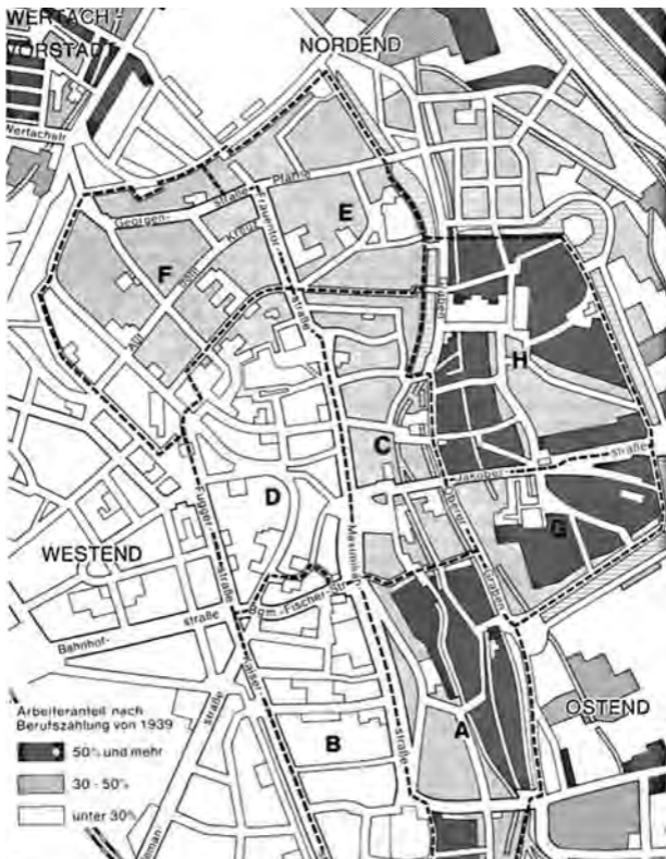
Bezeichnung der einzelnen Stadtquartiere um 1930

Im weitläufigen Gürtel um die Altstadt entstanden überwiegend Großbetriebe mit mehreren hundert Beschäftigten in der Textilindustrie, dazu zählten kombinierte Baumwollspinnereien und -webereien, wollverarbeitendes Gewerbe, Baumwollspinnereien