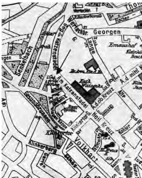
Katzenstadel auf einem Stadtplan von Augsburg, 1925

Während der NS-Zeit, als auch zahlreiche Frauen und Mütter inhaftiert waren, gab es regelrechte »Völkerwanderungen« von Kindern und Jugendlichen, um ihre Mutter an einem der zahlreichen Fenster zu entdecken. Ein Junge hatte extra seinen Kommunionanzug angezogen, um ihn der Mutter zu zeigen. Die Kinder versuchten von der Straße aus ihre Angehörigen an einem der zahlreichen Fenster zu entdecken.