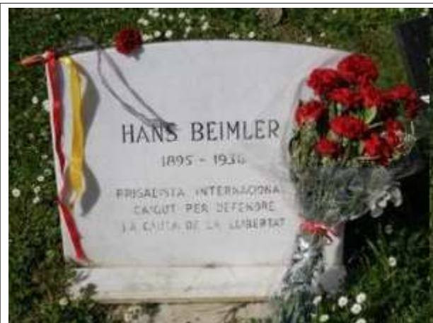
Grabstein auf dem Gedenkfriedhof ehemaliger Spanienkämpfer gegen das Francoregime in Barcelona

Ab Ende 1933 bis zum Sommer 1936 arbeitete er in Paris, Prag und Zürich für die Rote Hilfe, um den Widerstand in Deutschland zu unterstützen. Als Teilnehmer am spanischen Bürgerkrieg gegen die Franco-Faschisten fiel er am 1.12.1936 vor Madrid.